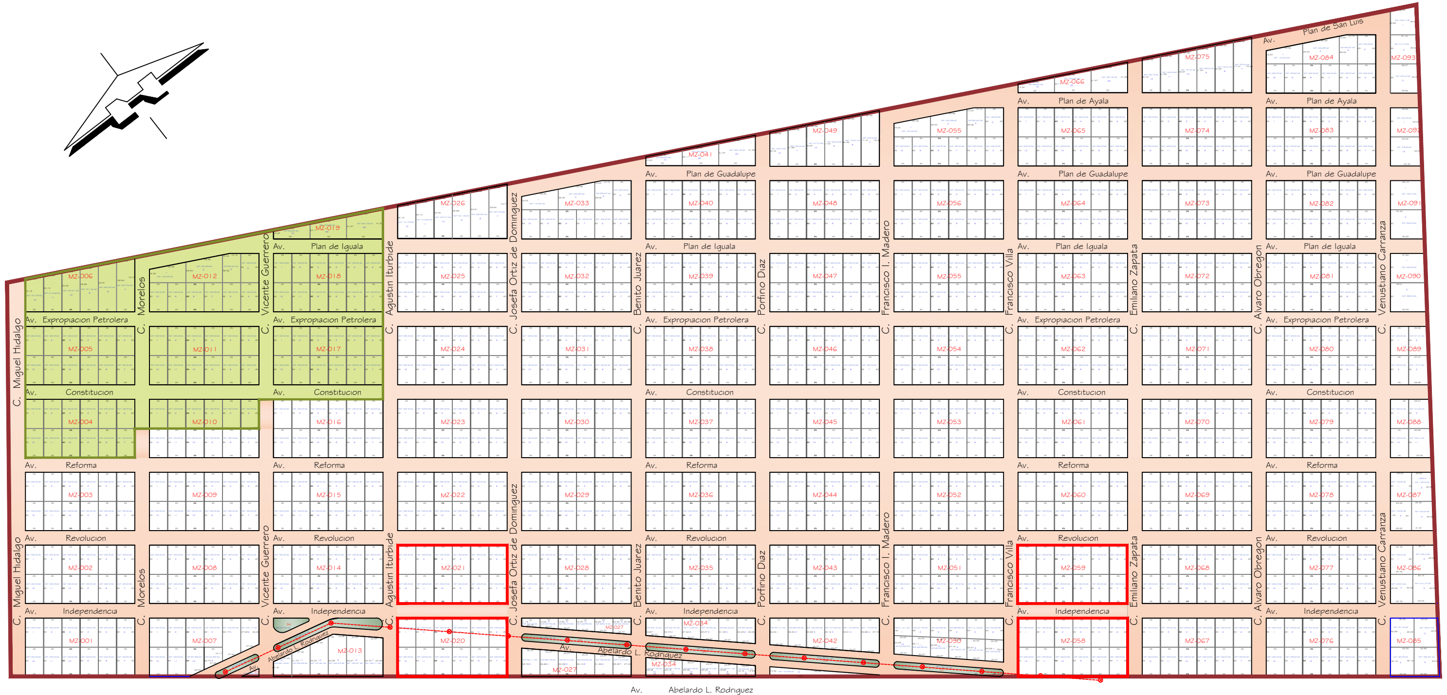
PLANO : PLANTA DE LOTIFICACION